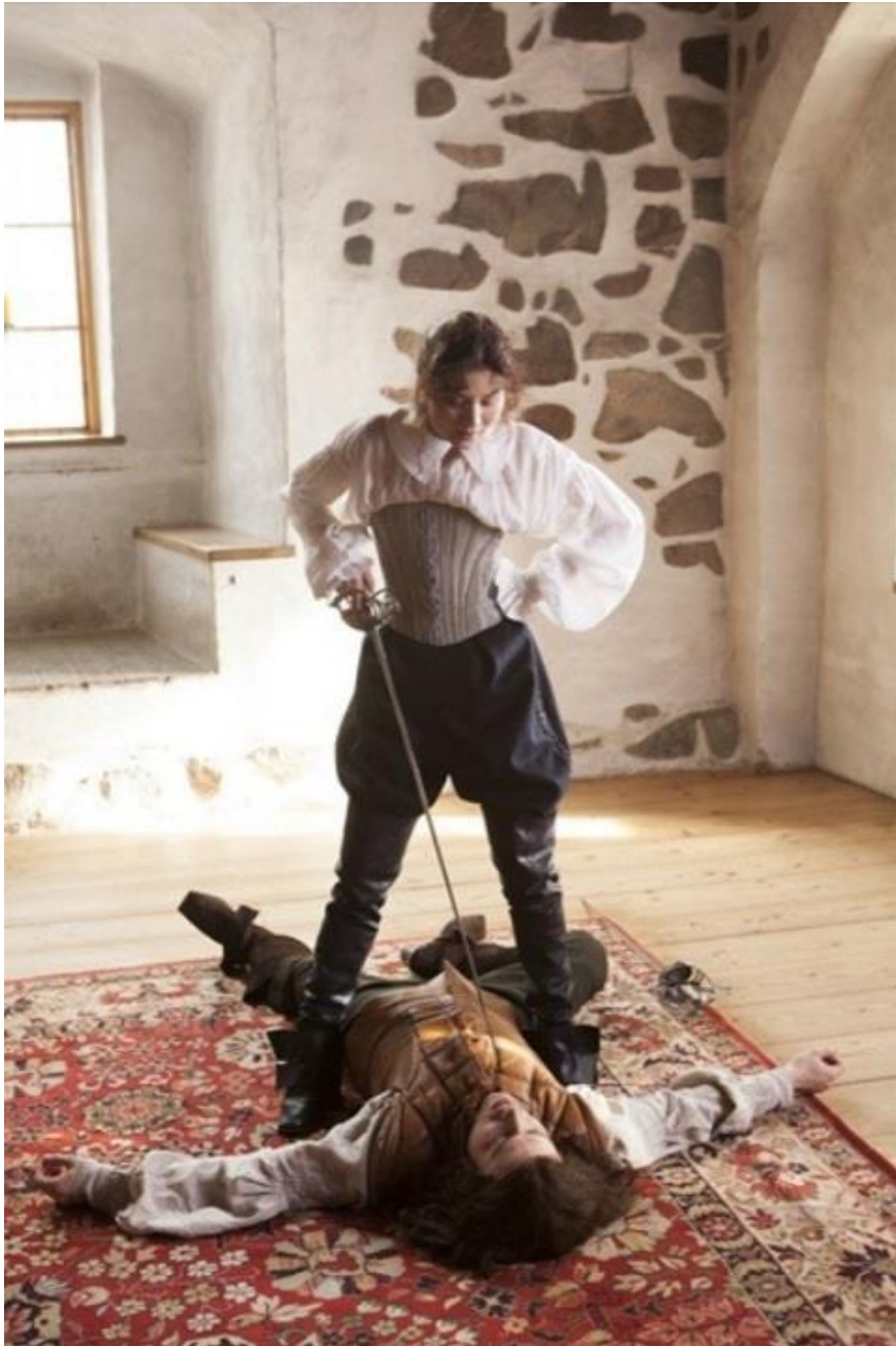
Rajojen rikkomista vuodesta 1640